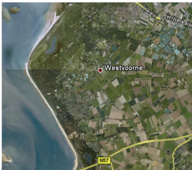
D66 zoekt ook financiële kustversterking voor Westvoorne.

Bij de Algemene Beschuwingen van de gemeente Westvoorne heeft D66 kritiek op het ontbreken van een sluitende meerjarenbegroting. Het college presenteert een sluitende begroting voor het jaar 2010. De fractie van D66 wijst er echter op dat ook na de gemeenteraadsverkiezingen in maart a.s. de nieuwe raad voldoende mogelijkheden moet hebben om een nieuw degelijk programma op te stellen.