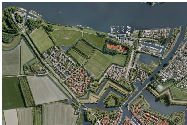
Meeuwoord, schitterend gelegen tussen meer en vesting

Voor het sportcentrum werd een gunstige plek gevonden aan de Groenekruisweg, nabij de N57. De woningbouw op de plek van de sportvelden kon als kostendrager fungeren. Dit werd de lijn, uitgezet naar de toekomst. Dat de bebouwing alléén op de te verlaten sportvel-