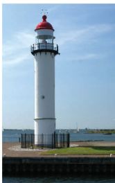
Ceci n'est pas Vincent

Vincent Vuurtoeren (pseudoniem van Leo Blok) schrijft wekelijks in 'Groot Hellevoet' met een licht sarcastische pen een column over lokale zaken uit Hellevoetsluis. Zijn humoristische stukjes zijn vaak scherpe observaties over politieke uitglijders en zaken die de politiek laat liggen. Zeker als de politiek een onderwerp als hete aardappel te lang laat liggen is Vincent Vuurtoeren in staat om via zijn column de zaak weer onder de