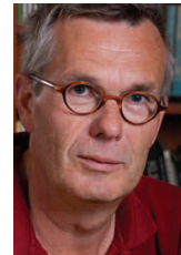
Guyon roept op tot het meeschrijven aan de nieuwsbrief.