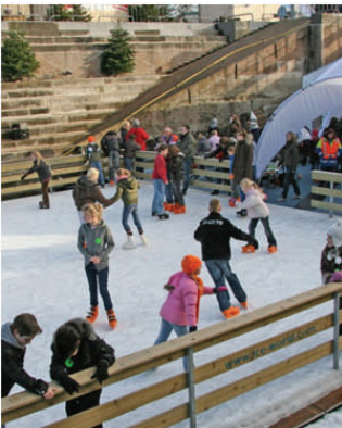
Fluitketelschuiven tijdens ijspret in Droogdok Jan Blanken?

Op 30 oktober ging de kogel door de kerk. Stichting Droogijs, een initiatief van Droogdok Jan Blanken en Maasdelta, besluit om de ijsbaan op de bodem van het 200 jaar oude dok door te laten gaan.